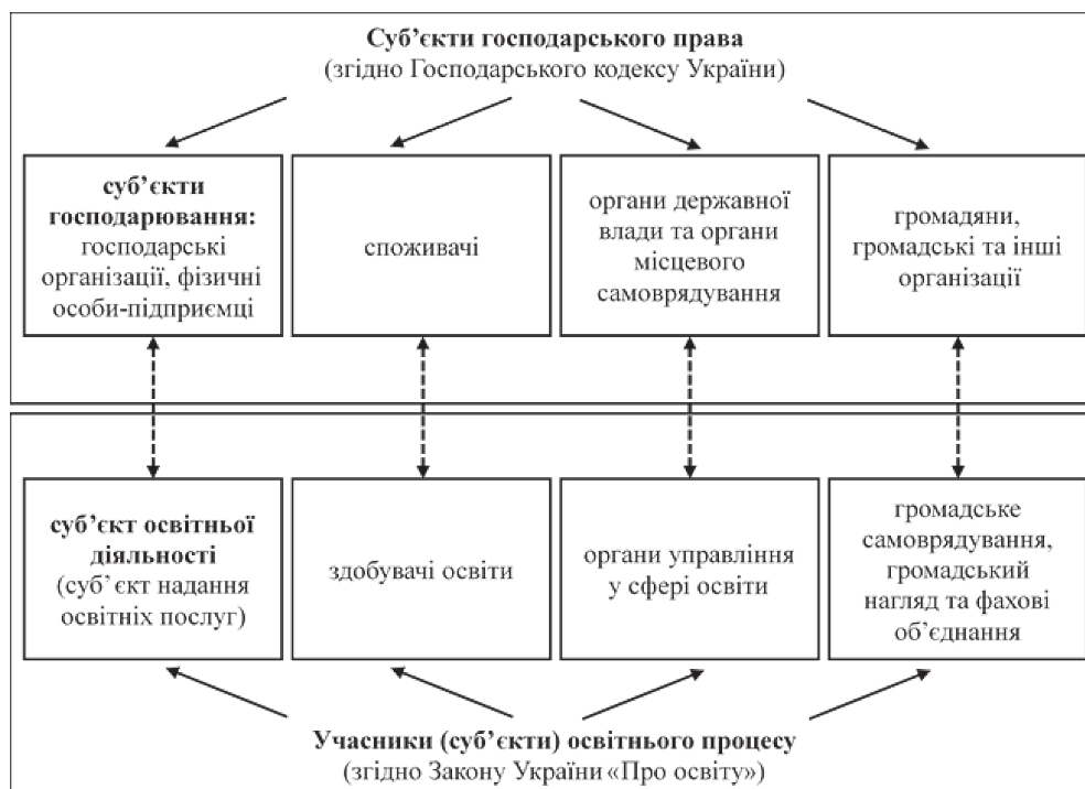
Рис. 1. Суб'єктний склад учасників освітнього процесу та їх взаємозв'язок із господарським законодавством

Відразу варто також звернути увагу на те, що законодавець на період приведення законодавства й установчих