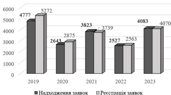
Рис. 2. Динаміка надходжень та реєстрації заявок на авторське право на твір