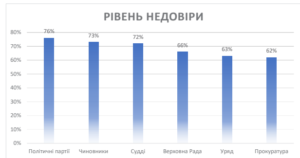
Діаграма 1. Рівень недовіри громадян до влади

недовіру до політичних партій (76% відсотків не довіряють), державного апарату (чиновників) (73%), судів (72%), Верховної Ради України (66%), уряду (63%), прокуратури (62%) і тд [7]. Тож можемо помітити, що показник не довіри до суду в порівнянні з 2021 роком не значно змінився, але має зрушення у позитивному ключі.