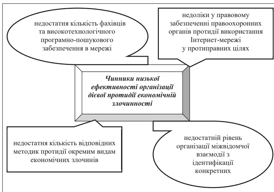
Рис. 2. Чинники низької ефективності організації дієвої протидії економічній злочинності (складено автором на основі [5, с. 102])