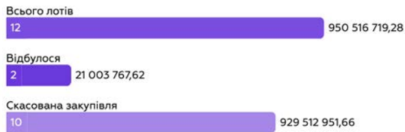
Рис. 2. Зведена таблиця організованих Акціонерним товариством «Українська залізниця» публічних закупівель в статусі замовника

Наразі, актами чинного законодавства встановлений особливий порядок звітування щодо здійснених публічних закупівель, які є формою обігу публічних коштів. Так, «воєнним» законодавством встановлено, що щодо договорів на суму від 1 грн до 50 000 грн публікується лише річний план закупівель без додаткових звітів. Якщо говорити про договори на суму від 50 000 грн до 100 000 грн без проведення процедур та застосування каталогу, то щодо них Замовник має публікувати річний план закупівель та звіт про укладений договір про закупівлю. За результатом укладення договорів унаслідок відкритих торгів та із використанням каталогу оприлюднюється річний план закупівель, договір про закупівлі разом із додатками до нього, повідомлення про внесення змін до договору про закупівлю та звіт про виконання договору про закупівлю.